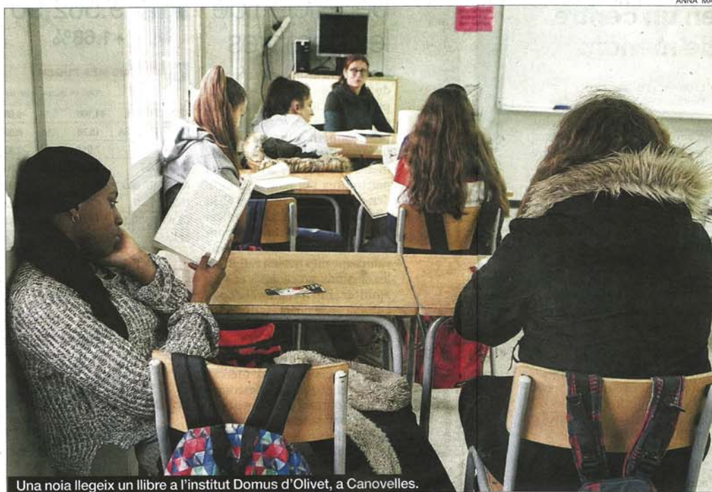
Una noia llegeix un llibre a l'institut Domus d'Olivet, a Canovelles.

Un dels instituts disposats a afegir-se a aquesta iniciativa és el Domus d'Olivet. El 20% del seu alumnat és d'origen subsaharià i a les aules de primer d'ESO prop del 60% dels nens o acaben d'arribar a Espanya o viuen en famílies molt humils. «Els seus pares tenen feines molt precàries i